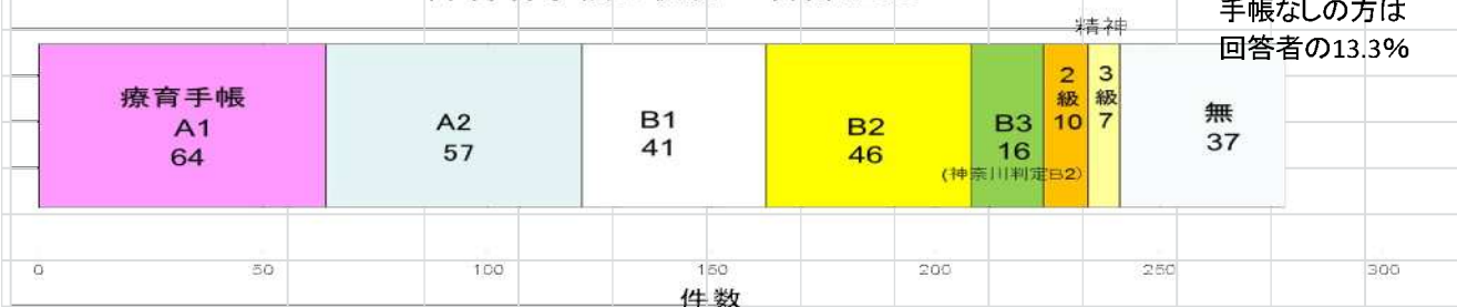
障害者手帳の状況 合計: 278